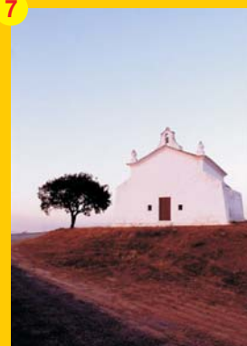
7 . Ermida de São Pedro das Cabeças (séc. XVI) . A 5 km de Castro Verde