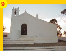
9 . Ermida de Nossa Senhora de Aracelis . A 3 km do Monte do Salto