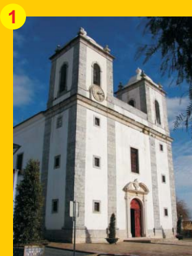
1 . Basilica Real (séc. XVI) . Praça do Município . Castro Verde