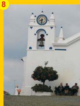
8 . Igreja Paroquial (séc. XV) . São Marcos da Atabueira