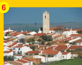
6 . Igreja Matriz de Casével (séc. XIV/XV) . Casével