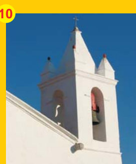
10 . Igreja Paroquial (séc. XVII) . Santa Bárbara dos Padrões