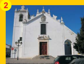
2 . Igreja das Chagas do Salvador (séc. XVII) . Rua D. Afonso I . Castro Verde