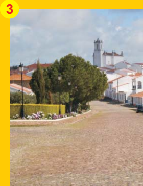
3 . Igreja Matriz de Santiago Maior (séc. XVIII) . Entradas