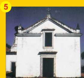
5 . Ermida de São Miguel (séc. XVIII) . A 5 km de Castro Verde . Estrada de Casével