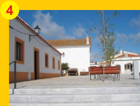
4 . Igreja da Misericórdia (séc. XV/XVI) . Entradas