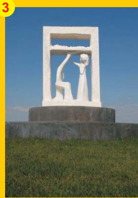
3 . "Planície Mediterrânica" . Autor: Lanchoto Pulidori . Localização: No cruzamento entre a Rua das Orquídeas e a Rua da Esteva (Rotunda)