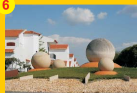
6 . Monumento "Evocativo das Freguesias" . Autor: António Veloso . Localização: Junto à Entrada Norte da vila (Rotunda)