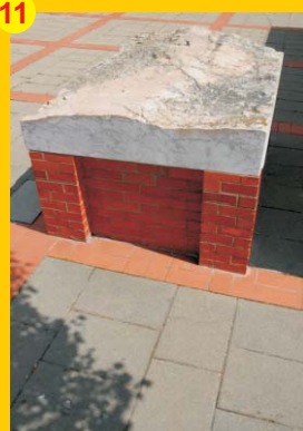
11 . Escultura "A Planície" . Autor: João Cutileiro . Localização: Biblioteca Municipal Manuel da Fonseca