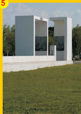
5 . Monumento "Ao 25 de Abril" . Autor: Domingos Tavares . Localização: Rua da Seara Nova