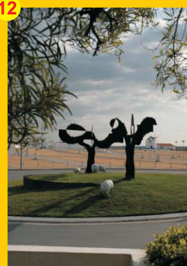
12 . Monumento "Evocativo da Feira Porcina" . Autor: António Trindade . Localização: Largo da Feira (Rotunda)