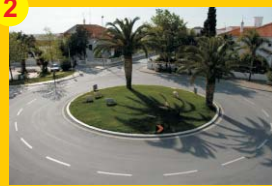
2 . Monumento "Evocativo do Ambiente Rural" . Autor: António Trindade . Localização: Rua da Seara Nova (Rotunda)