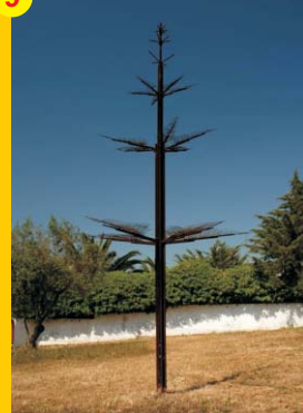
9 . "Árvore" . Autor: Paulo Pinheiro . Localização: Fórum Municipal