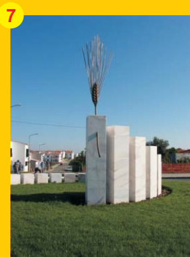
7 . "Caminho da Liberdade" . Autor: Manuel Santos Carvalho . Localização: Junto às Piscinas Municipais (Rotunda)