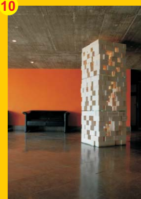
10 . Escultura . Autor: Pedro Fazenda . Localização: Fórum Municipal